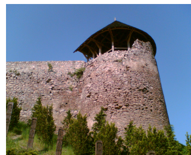
Nógrád várrom (V. 13.)