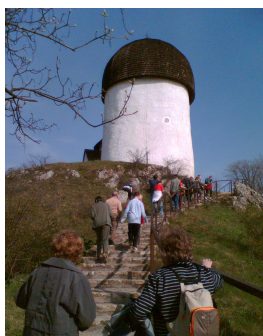
Öskü kerektemplom (IV. 15.)